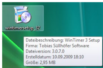
Abbildung 1: Die heruntergeladene Datei auf dem Desktop

Klicken Sie jetzt doppelt auf die heruntergeladene Datei, um die Installation aufzurufen. Es erscheinen nun zwei (unter Windows XP nur eine) Sicherheitsabfragen, die Sie mittels Klick auf „Ausführen“ und „Zulassen“ bestätigen.