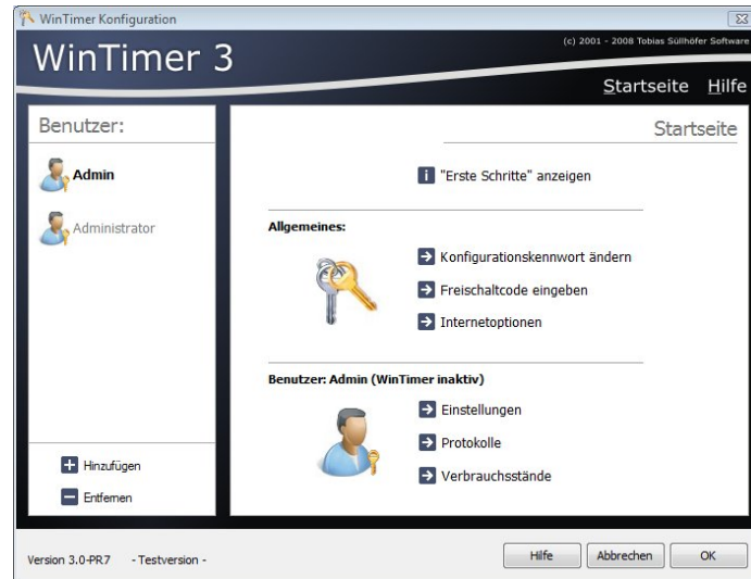
Abbildung 4: Die Startseite der Konfiguration

Nun erscheint die Startseite der Konfiguration des WinTimers. Von hier aus können Sie die gewünschten Einstellungen vornehmen, sowie den Freischaltcode zur Umschaltung zur Vollversion eingeben. Dazu liefert Ihnen die Programmhilfe weitere Informationen.